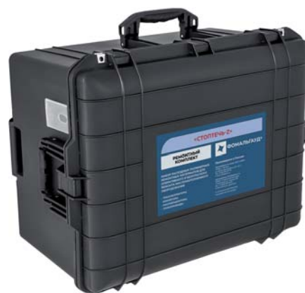
Ремонтный комплект Фомальгауд® «СтопТечь-Z»

Композитные ремонтные материалы Фомальгауд® подтверждают эффективность при оперативном устранении течей трансформаторного масла и утечки элегаза, при ремонтах изоляторов и ремонте железобетонных поддерживающих конструкций, ликвидации аварийных ситуаций. Они активно используются в приграничных регионах, новых территориях, зонах стратегического значения и на электроэнергетических объектах России. Специалисты компании на связи 24/7, выезжают на объекты, совместно с персоналом эксплуата-