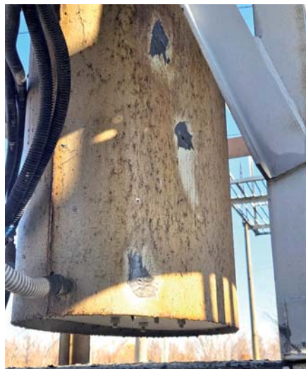
Ремонт оборудования материалами Фомальгауд®

127006, г. Москва, ул. Малая Дмитровка, 25, стр. 2 +7 (495) 374-69-96, +7 (928) 309-50-55, info@sfr.ru